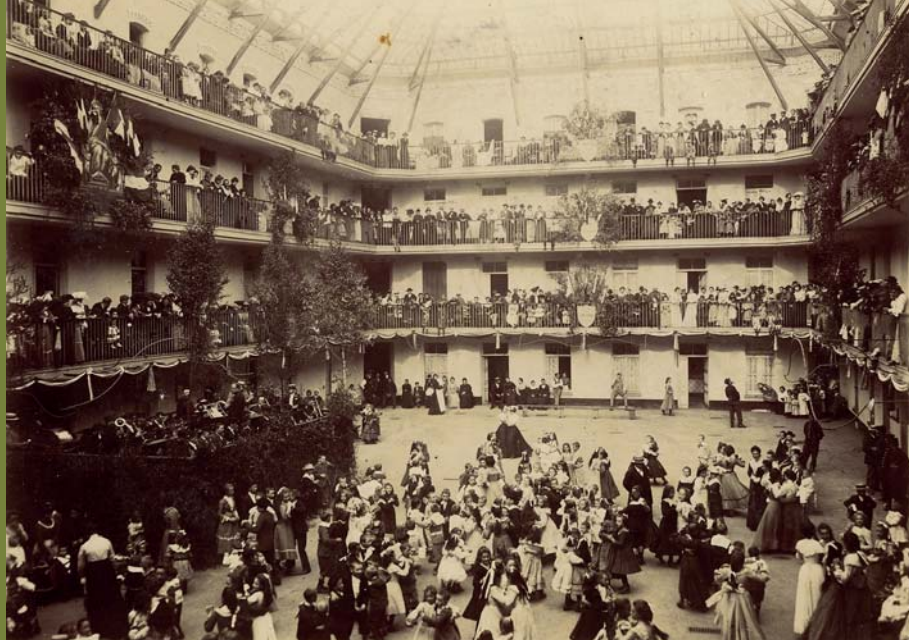
La fête de l'Enfance dans la cour du pavillon central

Mutations urbaines et construction de la cité du Moyen Âge à nos jours